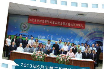
2013年5月主體工程簽約典禮

輔大醫院的創建，是輔仁大學百年精神的延續與實踐。輔仁大學創校於1925年北京，秉持天主教「真、善、美、聖」的教育理念，致力推動全人教育，深耕學術發展與社會關懷。創校初期即設立醫學預備課程與微生物實驗室，1936年更成為中國少數具研製斑疹傷寒疫苗能力的機構，展現對醫學教育的前瞻眼光。1961年來台復校，為延續初心，於1990年成立醫學院，成為華人世界唯一的天主教大學醫學院，肩負培育兼具專業與信仰素養之醫療人才的責任。惟因未設附設醫院，限制臨床教學與研究的發展。為完善醫學教育體系，在天主教會與全校師生努力下，歷經土地交換、募款、建設規劃等困境，2017年輔仁大學附設醫院正式開幕，成為新五泰樹地區的醫療新地標。