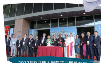
2017年9月輔大醫院正式開幕啟用

輔大醫院建築設計貫穿宗教意象，展現天主教精神的具體實踐，融合信仰、人文與醫療專業，開啟以愛為核心、以人為本的醫療服務新篇章，落實天主教關懷弱勢、醫療傳愛的使命，也成為輔仁大學校務發展的重要里程碑。