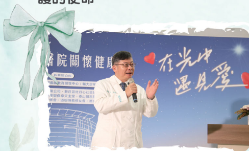
2023年12月「在光中遇見愛」健康關懷活動

輔大醫院成立志工隊協助弱勢照護，同時，社工室啟動「孤老一條龍」就醫綠色通道協助孤老貧病，並連續三年舉辦「在光中遇見愛」等關懷活動，深入獨居長者與弱勢族群，落實天主教醫療傳愛與社區健康守護的使命。