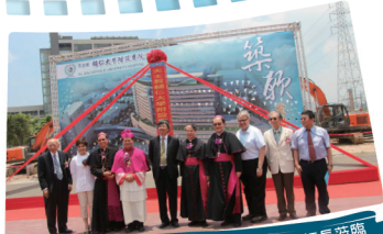
2013年6月輔大醫院動土典禮邀請重要師長蒞臨