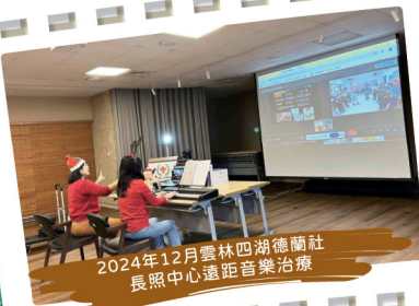
2024年12月雲林四湖德蘭社 長照中心遠距音樂治療