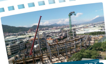
2015年12月輔大醫院鋼骨工程施工