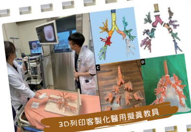
3D列印客製化醫用擬真教具