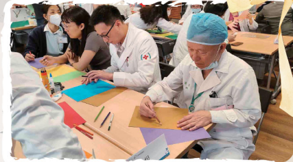
輔大醫院靈性關懷藝術治療