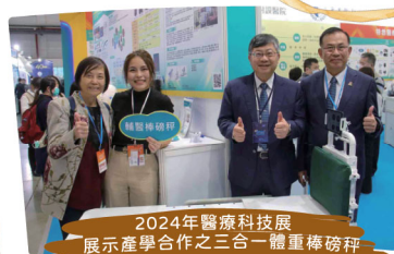
2024年醫療科技展 展示產學合作之三合一體重磅秤