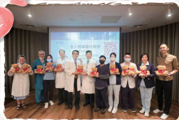
輔大醫院靈性關懷第一梯種子教師