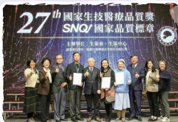
2025年輔大醫院榮獲SNQ國家品質標章多項獎項