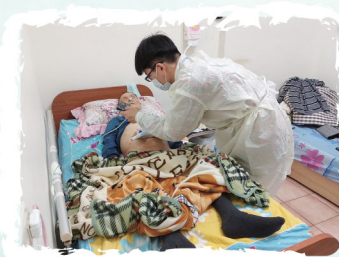
深入社區進行健康篩檢服務