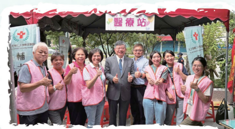
醫師為社區居家安寧病患進行手持超音波檢查