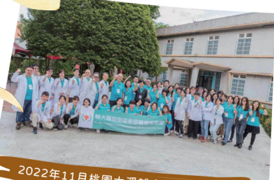
2022年11月桃園大溪輔大樂仁家園義診

在公益服務上，輔大醫院與音樂系、偏鄉教育關懷中心、中華電信基金會攜手啟動「遠距音樂療育計畫」，將音樂治療帶入偏鄉。為實踐知行合一，於2019年起，輔大醫院與各學系師生合作進行社會服務，義診行動擴及桃園、澎湖、花蓮等地，2024年更推動「方舟啟航」國際義診，與醫學院合作遠赴越南提供診療與衛教。未來，醫院將持續擴大校院合作、深化醫學研究、強化社會責任，實踐全人關懷與醫療使命。